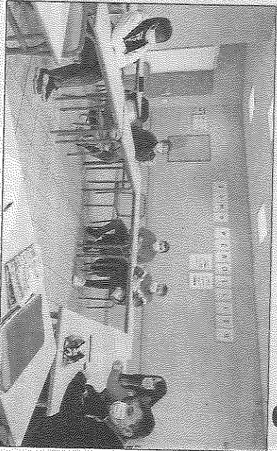
Les élèves sont revenus sur leurs parcours scolaires respectifs lors de ces échanges.

où chacun s'est exprimé librement et avec exaltation. Ils ont expliqué que la méthode de travail et d'apprentissage est différente dans cet établissement. Les professeurs ont su les écouter et répondre à leurs attentes tout en les soutenant au quotidien.