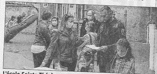
L'école Sainte-Thérèse a encore des places disponibles en petite et moyenne section de maternelle ainsi qu'en CP.