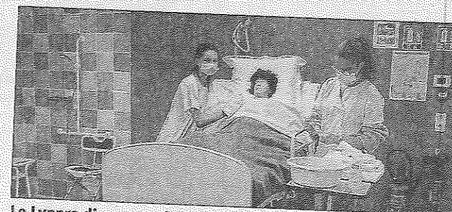
Le Lyppra dispose maintenant d'une grande salle de travaux pratiques pour s'initier aux soins destinés aux personnes.

Samedi matin, en raison du contexte sanitaire, une matinée d'accueil sur rendez-vous remplaçait encore cette année la traditionnelle opération portes ouvertes à l'école Sainte-Thérèse, rue Henri-Giroud, au collège Saint-Joseph et au lycée professionnel privé rural des Alpes (Lyppra), rue des Alpes tous les deux. Et les trois établissements privés murois ont dû gérer une belle affluence. C'était l'occasion pour les nouveaux élèves et leurs parents de visiter les nouvelles ailes de bâtiments du collège et du lycée. Des collégiens et lycéens volontaires, comme chaque année, participaient à cet accueil. L'école Sainte-Thérèse a encore des places disponibles en petite et moyenne section de maternelle ainsi qu'en CP. Pour le lycée professionnel, la filière qu'il propose est la préparation au bac pro Sapat (services aux personnes et aux territoires). Cette formation diplômante en 3 ans débouche sur un diplôme national ou diplôme d'État. Ce diplôme offre de nombreuses possibilités aussi bien pour entrer rapidement dans la vie active que pour poursuivre des études.